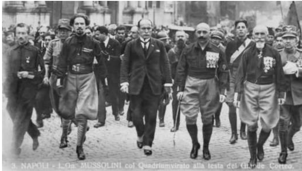
3. NAPOLI - L'On. MUSSOLINI col Quadrumvirato alla testa del Grande Corteo.

Mussolini instaura una dittatura: il REGIME FASCISTA.